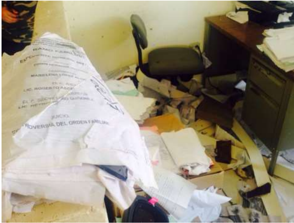
Los Juzgados del Sur del Estado sufrieron severas afectaciones tras el paso del Huracán "Odile".