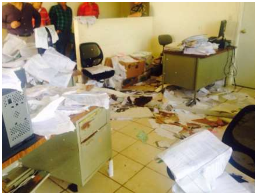
Daños provocados por el paso del huracán "Odile", en los Juzgados de San José del Cabo y Cabo San Lucas, en el Sur del Estado.